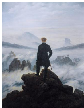
El caminante sobre el mar de nubes (Caspar David Friedrich)

EN RESUMEN: Tienes la oportunidad de pensar por ti mismo/a. Pero el pensar por uno/a mismo/a no es decir una ocurrencia, sino hacerlo teniendo en cuenta tus conocimientos y usando tus capacidades. El tipo de reflexión que se te pide tiene que ver con “pensar” el problema del texto u otro aspecto de la filosofía del autor, en su contexto o en otro contexto (actual o no) que tú decides.