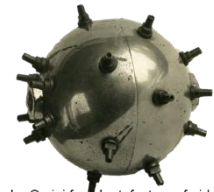
La bomba Orsini fue el artefacto preferido para algunos de los atentados anarquistas más sonados de finales del XIX y primeros del XX

El anarquismo alcanzó publicidad masiva por las acciones violentas realizadas por algunas de sus facciones más radicales contra dirigentes e intereses de Europa y América.