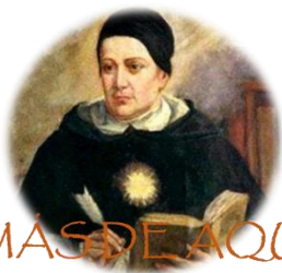
TOMÁS DE AQUINO

TOMÁS DE AQUINO (s. XIII) en su obra La Monarquía sostiene casi de modo idéntico posiciones como la de Aristóteles, y afirma que sólo en seno del estado y gracias al gobierno del rey es posible que los seres humanos se mantengan unidos en la búsqueda del bien común.